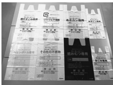
神山町指定ごみ袋

神山町は、ごみの減量化、リサイクル、分別ということを徹底する前に女性団体の方々と、委員会を立ち上げて現在の方式に至っている。この神山方式が継続するのが経費としても間違いなく安いと思うので、東部広域ごみ処理計画には参加しないと考えている。