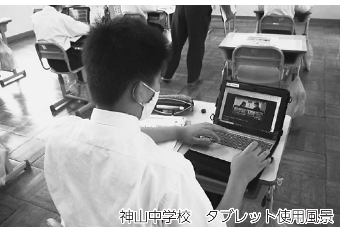
神山中学校 タブレット使用風景