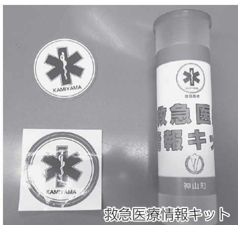
救急医療情報キット

作成しており、65歳以上の高齢者のほか、高齢者以外でも介護保険における要介護3から要介護5までの方、身体障害者手帳1級、2級の方、難病患者で災害時の避難に支援が必要な方などについては、かかりつけ医や親族、飲み薬等を記載した台帳を作成し、役場健康福祉課で保管して緊急時等に活用することとなっている。