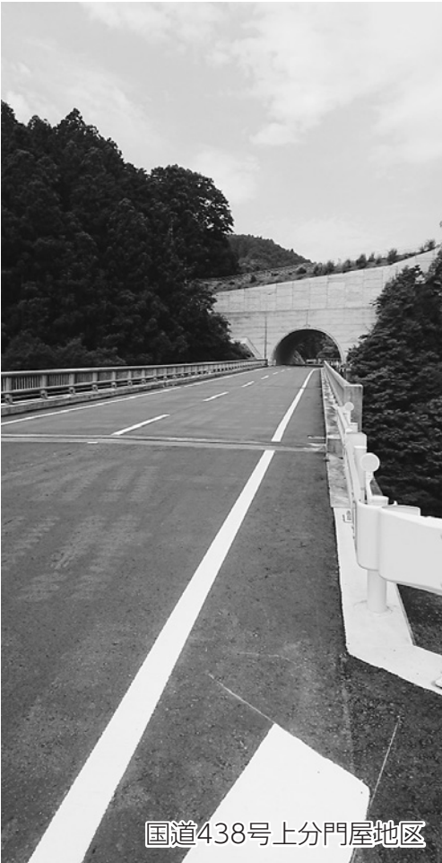
国道438号上分門屋地区

今後についても、保守点検業者を入れているので、学校と常に情報連絡を取りながら対応していく。