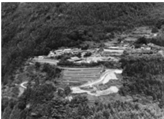
昭和56年2月 本根川集落（北向き）遠景

の住民が各々の幸せの価値観の尺度で今幸せなのかを検証してみる必要があるのではないかと。幸せであればそれで良いがそうでないとしたら行政は幸せに生活出来る様、多様な施策の対応をする責務があるのではないだろうかと思いつながら本根川を後にした。