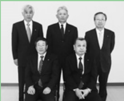
議会広報調査特別委員会

町民のみなさまに議会に興味を持っていただけるような明るく、わかりやすい紙面づくりを心がけます。