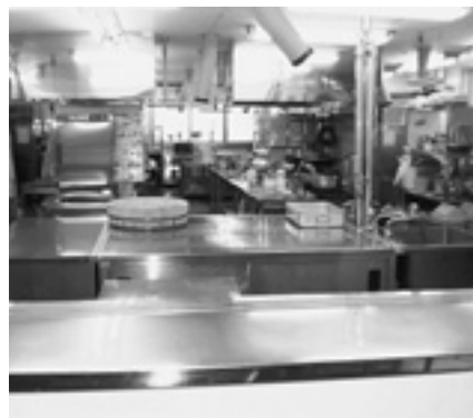
神山町養護老人ホーム調理場

所管内の各施設が加入する集団給食施設協議会では、緊急時食事を提供してもらえる事業者を指定しているとのこと。緊急時の該当施設―指定業者―徳島保健所との連携対応が出来るシステムが機能する仕組みになっている。(町長)