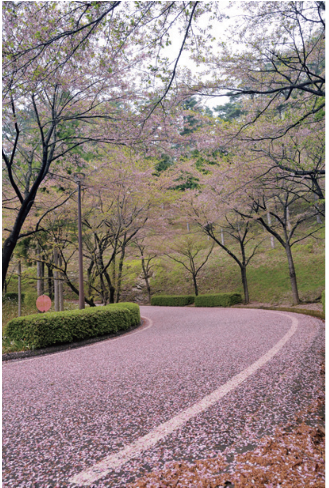
神山森林公園 3,000本桜競艶の名残