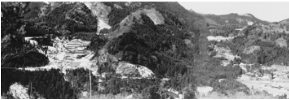
昭和56年2月 本根川集落（南向き）遠景