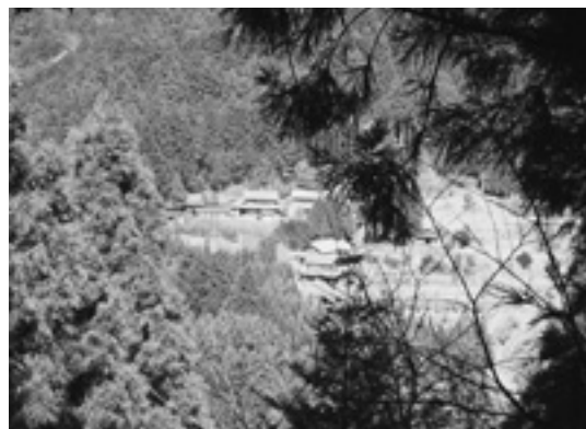
平成21年4月 本根川集落（北向き）遠景