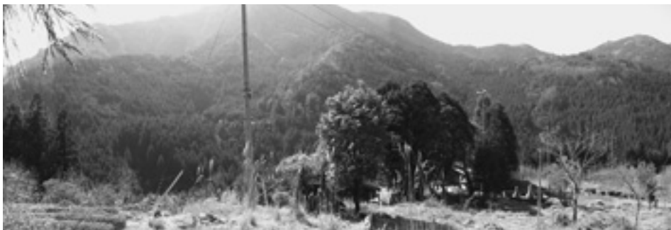
平成21年4月 本根川集落（南向き）遠景

の住民が各々の幸せの価値観の尺度で今幸せなのかを検証してみる必要があるのではないかと。幸せであればそれで良いがそうでないとしたら行政は幸せに生活出来る様、多様な施策の対応をする責務があるのではないだろうかと思いつながら本根川を後にした。