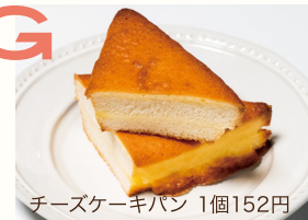
チーズケーキパン 1個152円