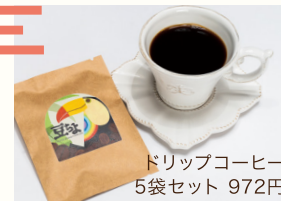
ドリップコーヒー 5袋セット 972円