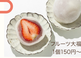
フルーツ大福 1個150円~