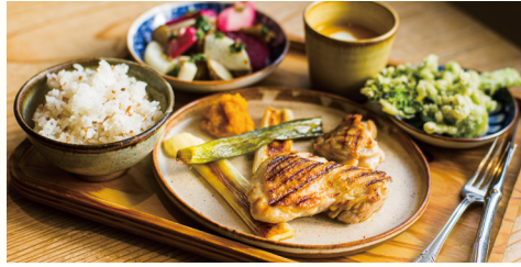
週替わりランチ 1,850円

気軽に立ち寄れる地域の台所として人気のかま屋。自社農園や地元の農家さんが丹誠込めて育てた季節の食材を生かしてシンプルに調理。神山の“美味しい”がお皿の上に凝縮されています。