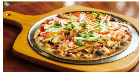
ピザ・マルゲリータ 1,200円

神山最西端の峠にある神山シャングリ・ラ園内に構えたカフェ。トマトやモッツァレラチーズをのせて、石窯でこんがり焼いたピザ・マルゲリータは、もちもちした食感がたまらない美味しさ。