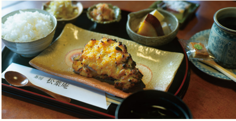
日替わりランチ 1,500円

落ち着いた佇まいの店内でいただく日替わりランチは、メインが魚と肉から選べて、その日仕入れた新鮮な食材を使った和食ベースの御膳。食後の珈琲とデザート付きなのは、まちの喫茶店ならではの。