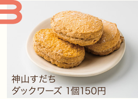
神山すだちダックワーズ 1個150円