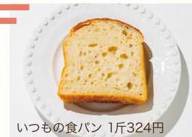
いつもの食パン 1斤324円