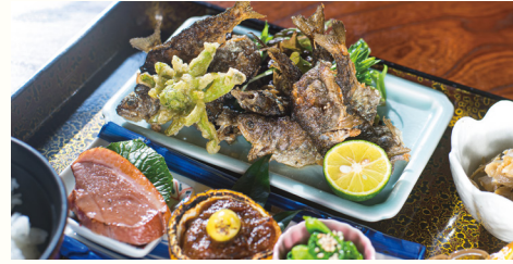
マスの唐揚げ定食 1,200円

1959年創業で、敷地内の釣り堀ではニジマスやアメゴ釣りが楽しめる。生け簀から取り出して調理された新鮮なニジマスの唐揚げは、ほろっと柔らかく、甘酢が染み込んでくせになる美味しさ。