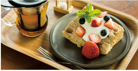
シフォンケーキ 650円

神山出身のパティシエがつくる、しっとりふわふわのシフォンケーキは、神山の湧き水を使ったこだわりの逸品。色とりどりの季節のフルーツと、甘さひかえめの生クリームで心も体も元気に。