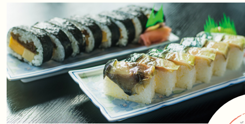
巻き寿司・パッテラ 各400円

まちの食堂・仕出し屋として親しまれる秀之家。寿司屋で修行したことがある大将が心を込めてつくる巻き寿司やパッテラは、具のひとつひとつにこだわりがあり、どこか懐かしい素朴な味わい。