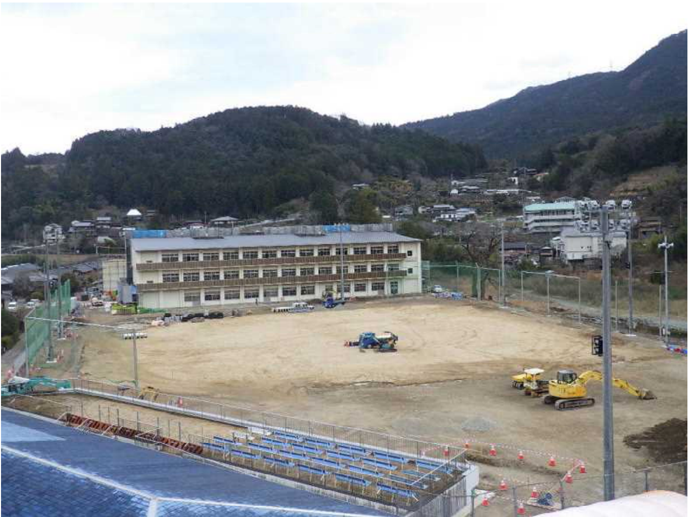
(神領小学校より撮影)