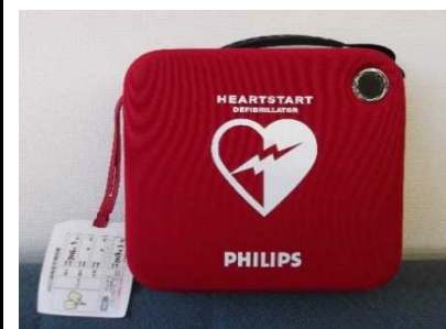
神山町役場に設置しているAED

AEDや救急車が到着するまでの間、少しでも心臓から血液を全身に送るために胸骨圧迫などの心肺蘇生法を実施することが大切です。