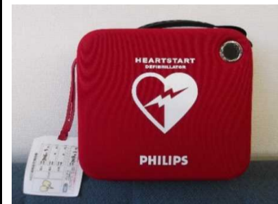
神山町役場に設置しているAED

AEDや救急車が到着するまでの間、少しでも心臓から血液を全身に送るために心臓マッサージなどの心肺蘇生法を実施することが大切です。