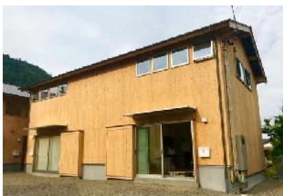
【女子棟：新築木造シェアハウスを活用】