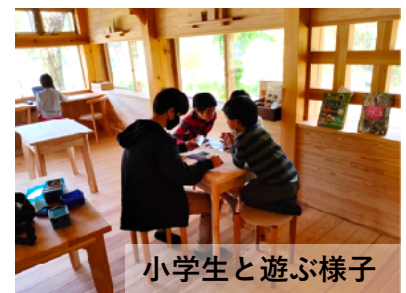
小学生と遊ぶ様子

休日は、平日と同様に食事づくりや話し合い等暮らしに必要なことは行いますが、それ以外は各自自由に過ごしています。例えば、地域の活動に参加したり、まちの文化施設で地域の方と交流をしたり。徐々に地域のつながりが増えてくると、阿波踊りやアルバイトをする寮生もいます。あゆハウスでは、神山を体感するツアーや地域懇親会を定期開催しています。