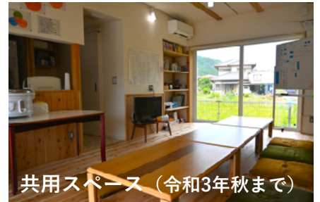
共用スペース（令和3年秋まで）