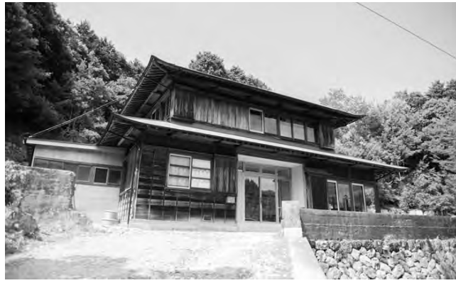
▲西分の家は神山町民家改修プロジェクトの第1号物件。同プロジェクト2棟目の改修工事がもうすぐ寄りで竣工予定です。

西分の家の1階には、サロンとキッチンなどの2つの共有スペースがあります。集会や上映会、ワークショップなどできる板間の共有サロン。みんなで料理をして、食卓を囲むことのできる土間つづきの共有キッチン。ガラス戸の仕切りを解放して一体で使ったり、広い庭まで連続的に使ったりと、柔軟に空間を使い分けられることができます。