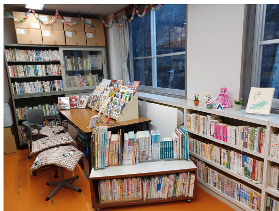
阿川公民館 図書室