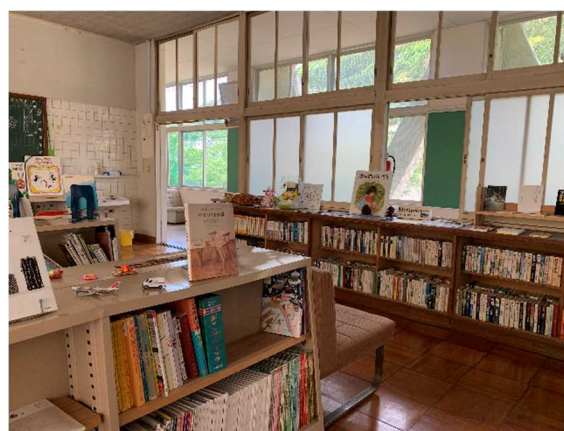
ほんのひろば 広野校舎図書室