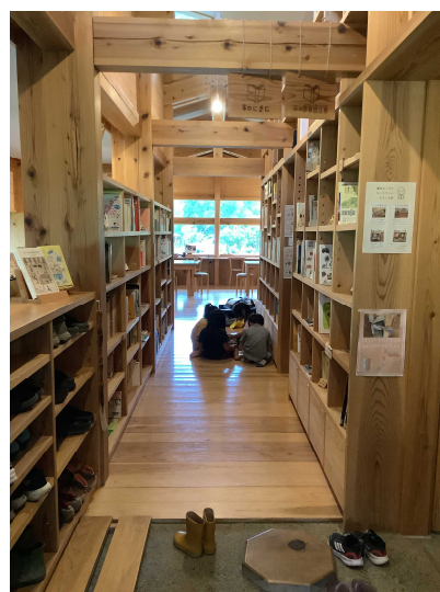
鮎喰川コモン 本の廊下